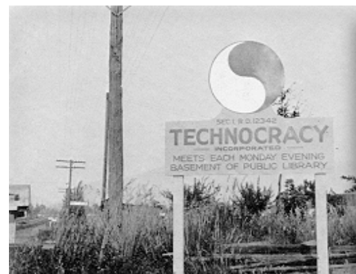
1 - Znak Technocracy Inc., který vyjadřuje rovnováhu

[1] Pojem technokracie pochází z řečtiny a znamená „vládu techniků“. Klíčovou roli zde hraje vrstva vysoce postavených specialistů a manažerů. Vznik tohoto způsobu vlády se přikládá reakcím na rozpory kapitalistické ekonomiky, tedy že kapitalistické